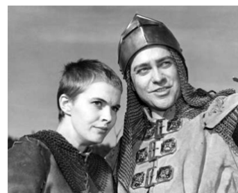
1956 SAINTE JEANNE (Saint Joan) d'Otto Preminger avec Jean Seberg