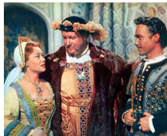
1952 LA ROSE ET L'ÉPÉE (The Sword and the Rose) de K. Annakin avec G. Johns, J. Robertson Justice