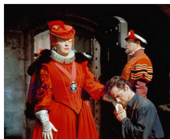
1954 LE SEIGNEUR DE L'AVENTURE (The Virgin Queen) d'Henry Koster avec Bette Davis