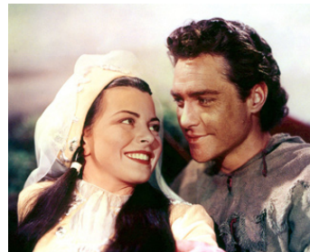
1951 ROBIN DES BOIS... (The Story of Robin Hood) de Ken Annakin avec Joan Rice