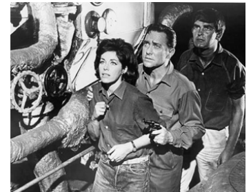
1963 COAST OF SKELETONS de Robert Lynn avec Marianne Koch, Dale Robertson