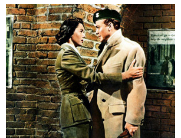
1955 AU SIXIÈME JOUR (D-Day the sixth of June) d'Henry Koster avec Dana Wynter