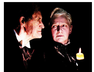
1981 LE MANOIR DE LA TERREUR (House of the long Shadows) de Pete Walker avec J. Carradine