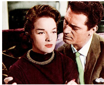
1958 TUEURS À GAGES (Intent to kill) de Jack Cardiff avec Betsy Drake