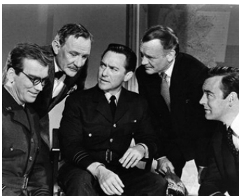
1964 OPÉRATION CROSSBOW de M. Anderson avec Trevor Howard, Richard Johnson