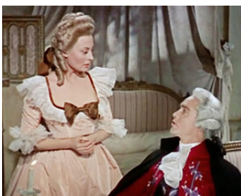
1955 MARIE-ANTOINETTE de Jean Delannoy avec Michèle Morgan