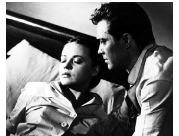
1953 SECRETS D'ALCOVE, Le Billet de Logement d'Henri Decoin avec Jeanne Moreau