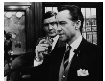
1968 SUBTERFUGE (Subterfuge) de Peter Graham Scott avec Gene Barry