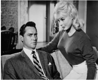
1959 ENTREZ CHEZ MOI SANS FRAPPER (Don't bother to knock) de C. Frankel avec E. Sommer