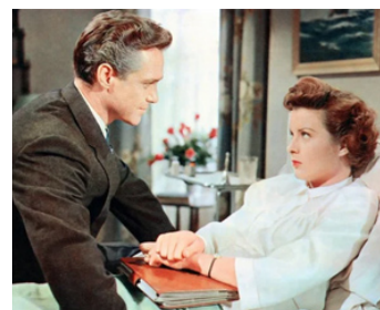
1954 AU SERVICE DES HOMMES (A Man called Peter) d'Henry Koster avec Jean Peters