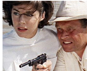
1963 DEATH DRUMS ALONG THE RIVER de Lawrence Huntington avec Marianne Koch