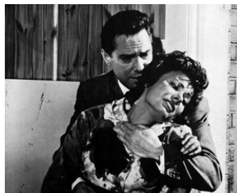
1965 LE SCANDALE DE LA VILLA FIORITA de Delmer Daves avec Anne Heywood