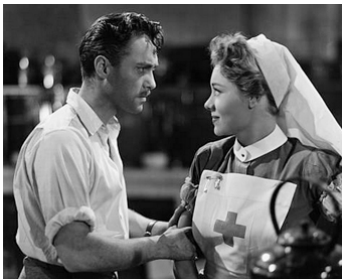
1950 LA CHAIR ET LE SANG (Flesh and Blood) d'Anthony Kimmins avec Glynis Johns