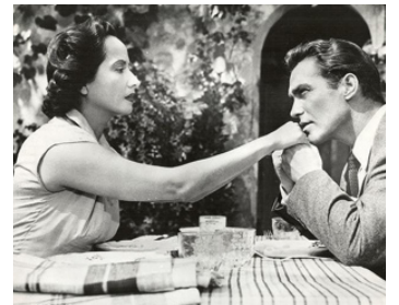
1951 L'INCONNU DE MONACO (24 Hours of a Woman's Life) de V. Saville avec M. Oberon