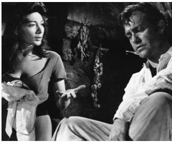
1957 LA RIVIÈRE DES ALLIGATORS (The naked Earth) de Vincent Sherman avec Juliette Gréco