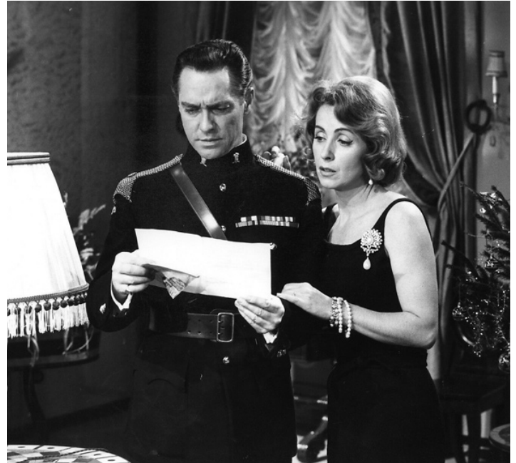
1962 LE CRIME NE PAIE PAS de Gérard Oury avec Danielle Darrieux