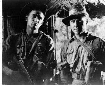
1960 PATROUILLE PERDUE (The long and the short and the tall) de L. Norman avec David McCallum