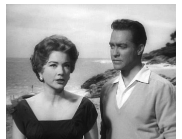
1957 L'HOMME À DÉMASQUER (Chase a crooked shadow) de M. Anderson avec Anne Baxter