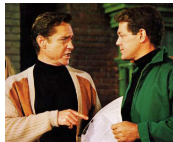
1966 RUE DES HIPPIES (The Love Ins) d'Arthur Dreifuss avec James MacArthur