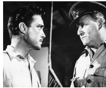
1958 LE TRÂITRE EST PARMİ NOUS (Danger within) de Don Chaffey avec Bernard Lee