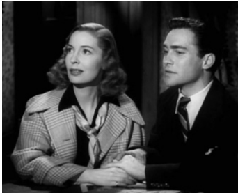
1949 VOYAGE INTERROMPU (The Interrupted Journey) de Daniel Birt avec Valerie Hobson