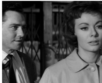
1962 LE FAUVE VA FRAPPER (The very Edge) de Cyril Frankel avec Anne Heywood