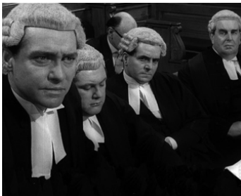
1962 THE BOYS (The Boys) de Sidney J. Furie avec Robert Morley