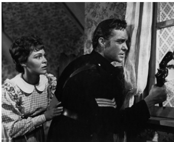
1961 LES DIABLES DU SUD (The Hellions) de Ken Annakin avec Anne Aubrey