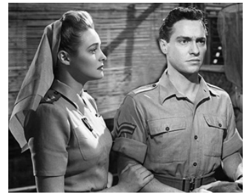
1948 LE DERNIER RIVAGE (The Hasty Heart) de Vincent Sherman avec Patricia Neal