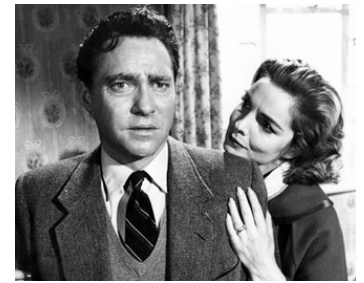
1959 QUAND GRONDE LA COLÈRE (Never let go) de John Guillermin avec Elizabeth Sellars