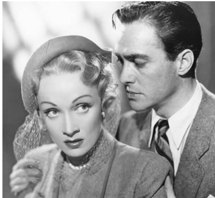
1950 LE GRAND ALIBI (Stage Fright) d'Alfred Hitchcock avec Marlene Dietrich