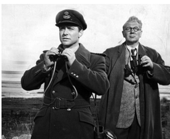
1953 LES BRISEURS DE BARRAGES (The Dam Busters) de M. Anderson avec Michael Redgrave