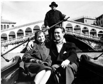
1952 ENQUÊTE À VENISE (Venitian Bird) de Ralph Thomas avec Eva Bartok