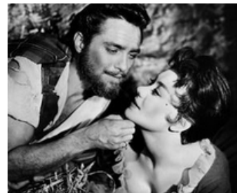
1953 ÉCHEC AU ROI (Rob Roy, the Highland Rogue) d'Harold French avec Glynis Johns