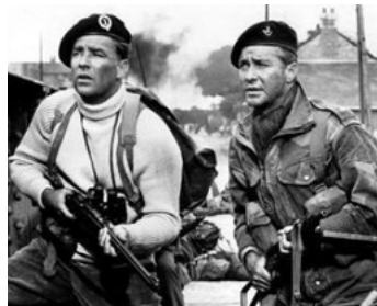
1962 LE JOUR LE PLUS LONG (The longest Day) de K. Annakin avec Peter Lawford